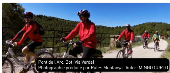
Pont de l'Arc, Bot (Via Verda)

Parmi les 100 km de route entre la Puebla de Híjar et Tortosa, 49 passent par la Réserve de la Biosphère des Terres de l'Ebre. La Voie Verte traverse les municipalités d'Arnes, Horta de Sant Joan, Bot, Prat de Comte, Pinell de Brai, Benifallet, Xerta, Aldover, EMD Jesus, Roquetes et Tortosa. Ayant un dénivelé cumulé de 400 mètres et une difficulté peu importante, elle peut donc se faire à bicyclette, à pied ou à cheval. Il y a une partie de l'itinéraire qui est adaptée aux personnes handicapées.