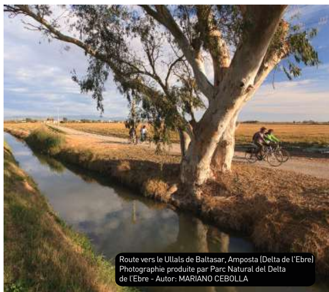
Route vers le Ullals de Baltasar, Amposta (Delta de l'Ebre)

En plus, les visiteurs ont à leur disposition des offices de tourisme et points d'information, parmi lesquels se trouvent celles des deux parcs naturels (Els Ports et le Delta de l'Ebre), où vous trouverez toutes sortes de détails sur les pistes cyclables et les services associés.