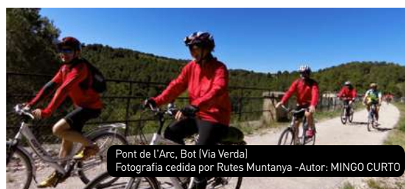
Pont de l'Arc, Bot (Via Verda)

Híjar y Tortosa, 49 están incluidos en la Reserva de la Biosfera de Terres de l'Ebre. La Vía Verde atraviesa los municipios de Arnes, Horta de Sant Joan, Bot, Prat de Comte, Pinell de Brai, Benifallet, Xerta, Aldover, EMD Jesús, Roquetes y Tortosa. Con un desnivel de 400 metros acumulados y una baja dificultad, es apta para hacer en bicicleta, a pie o a caballo. Hay una parte del trazado que está adaptado para personas con discapacidad.