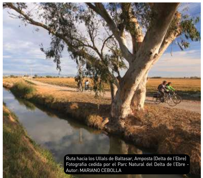
Ruta hacia los Ullals de Baltasar, Amposta (Delta de l'Ebre)

Asimismo, los visitantes tienen a su disposición oficinas de turismo y puntos de información, entre los cuales, los de los dos Parques Naturales (Els Ports y Delta de l'Ebre), donde encontraréis todo tipo de detalles sobre los itinerarios ciclistas y los servicios asociados.