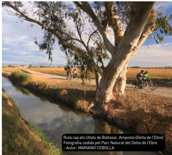
Ruta cap als Ullals de Baltasar, Amposta (Delta de l'Ebre)

Així mateix, els visitants tenen a la seva disposició oficines de turisme i punts d'informació, entre els quals hi ha els dels dos Parcs Naturals (Els Ports i Delta de l'Ebre), on hi trobareu tota mena de detalls sobre els itineraris ciclistes i els serveis associats.