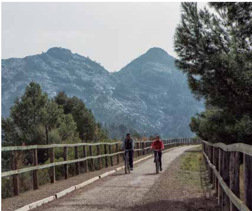
Photo de la Voie verte à son passage dans la Terra Alta. À côté, vue générale de Tortosa.