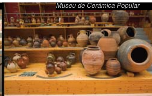
Museu de Ceràmica Popular