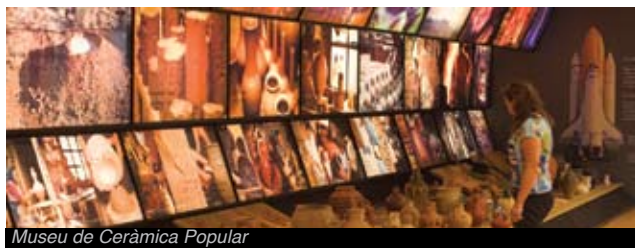
Museu de Ceràmica Popular

> Museu Comarcal del Montsià a Amposta. En època dels romans Amni Imposita , que significa posada sobre el riu .