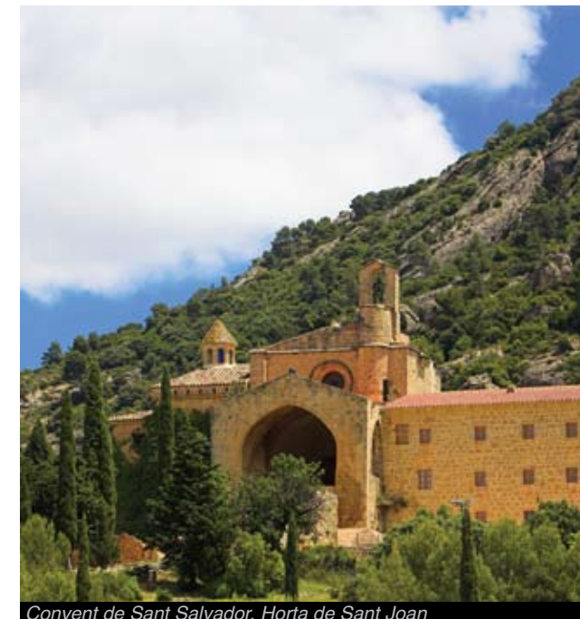
Convent de Sant Salvador, Horta de Sant Joan

Sense dubte, un dels personatges més cèlebres vinculats al territori fou el pintor Pablo Picasso . Les seves breus però intenses estades a Horta de Sant Joan a la Terra Alta, van marcar l'inici del cubisme i va esdevenir un punt i a part en el desenvolupament de les avantguardes pictòriques del segle XX.