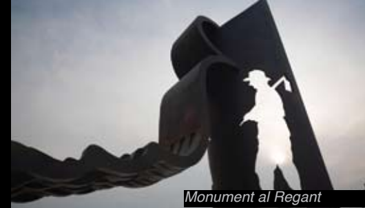
Monument al Regant