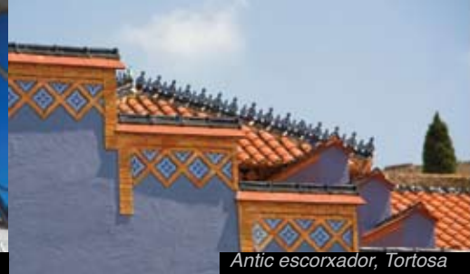
Antic escorxador, Tortosa