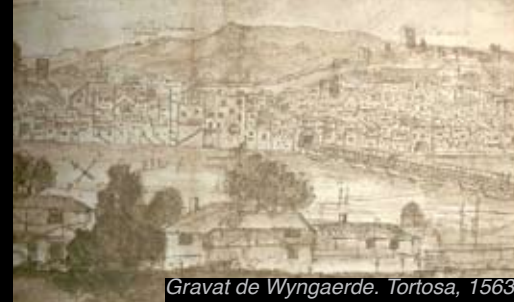
Gravat de Wyngaerde. Tortosa, 1563