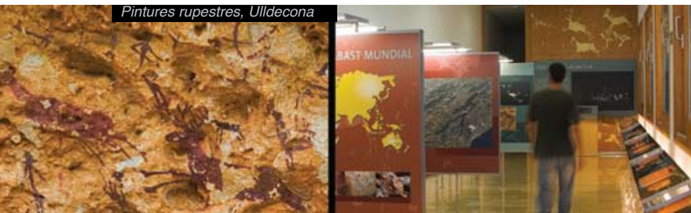
Pintures rupestres, Ulldecona

> Els ibers de la Vall de l'Ebre s'anomenaven iler-cavons i cercaven punts estratègics per instal·lar-s'hi.