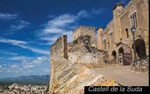
Castell de la Suda