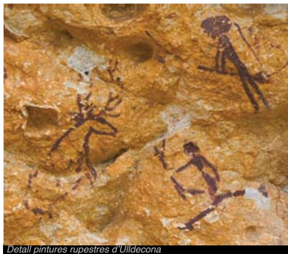
Detall pintures rupestres d'Ulldecona

Podeu seguir la vostra pròpia ruta cap a Freginals , la Cova de les Calobres, l'Abric de Masets -balma poc profunda on es conserven dos grups de pintures- i a l'Abric de Llibreres, on trobareu dotze pictogrames d'estil realista, entre ells una cabra i cèrvols. A Alfara de Carles , trobareu la Cova Pintada. Al Perelló , l'Abric de Cabra Feixet -on podreu diferenciar tres grups i localitzar un arquer i la Cova de Calobres. I a la Ribera d'Ebre, a Tivissa , compten amb quatre jaciments on s'han documentat restes pictòriques, com són la Cova del Ramat, la Cova del Cingle, la Cova del Pi i la del Taller.