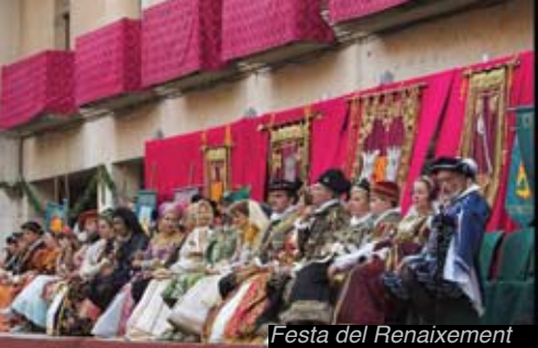
Festa del Renaixement