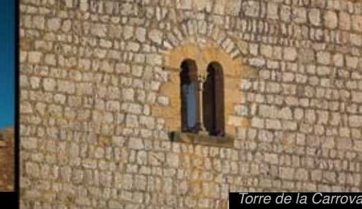
Torre de la Carrova