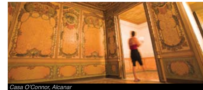
Casa O'Connor, Alcanar

El 1912, s'hi van trobar un conjunt d'arracades, braçalets, anells, mànecs d'espill i un petit tresor de vint-i-nou monedes. Però, va ser el 1927 quan es produí la descoberta més important: l'anomenat Tresor de Tivissa , format per un conjunt de peces religioses únic a Catalunya.