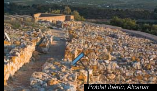
Poblat ibèric, Alcanar

> patrimoni de la humanitat per la UNESCO. El conjunt més important de Catalunya