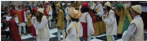
Amb l'Escacs vivents fruireu petits i grans, Móra enceta la festa amb el sopar morisc al castell

> Móra Morisca a Móra d'Ebre. Móra d'Ebre reviu el passat sota la dominació àrab, on vivien musulmans, jueus i cristians. Durant un cap de setmana de la primera quinzena de juliol, els bufons i la gastronomia àrab despleguen la imaginació, el mercadal o mercat d'artesans mostra els oficis antics com els ferrers, les filadores, els forners, els picapedrers, espectacles de música, dansa i teatre fan que Móra torni a ser morisca, amb la creu i la mitja lluna.