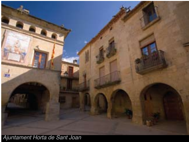
Ajuntament Horta de Sant Joan

El nucli antic del poble conserva el seu caràcter medieval amb carrers estrets, és per això que no heu de visitar el nucli amb vehicle, o us perdeu la mirada d'un poble encantador. Als voltants de la plaça de l'ajuntament teniu dos llocs perfectes per fer un descans. El conjunt arquitectònic d'Horta, que està declarat Bé Cultural d'Interès Nacional, aporta la plaça porticada de l'Església gòtica, l'ajuntament renaixentista i els carrers que l'envolten, on localitzareu tot seguit els habitatges monumentals construïts al segle XVI. La presó està als baixos de l'ajuntament, on es troba l'exposició que explica l'evolució urbana d'Orta. La Casa de la Comanda o Delme és un palau renaixentista del segle XVI-XVII, on antigament residia el comanador de l'orde de l'Hospital.