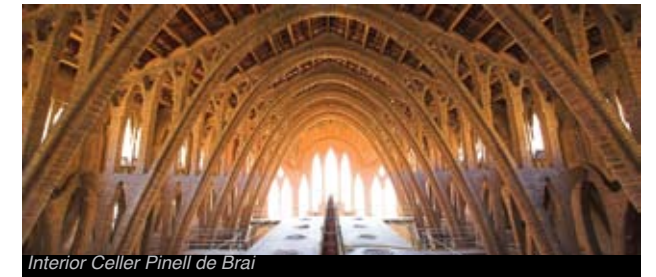
Interior Celler Pinell de Brai

El Celler cooperatiu de Pinell de Brai conegut com La Catedral del Vi , és l'obra mestra de l'arquitecte Cèsar Martinell i Brunet -deixeble de Gaudí-. D'estil noucentista destaca per la seva façana amb decoracions ceràmiques pintades i el joc d'arcades interiors obrats amb maons.