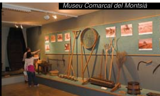
Museu Comarcal del Montsià