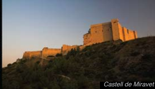
Castell de Miravet