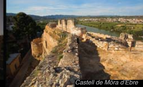
Castell de Móra d'Ebre