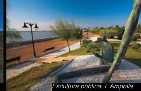
Escultura pública, L'Ampolla