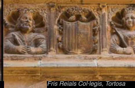
Fris Reials Col·legis, Tortosa

> Catedral de Santa Maria de Tortosa. La desapareguda seu romànica estava situada al mateix recinte. Les obres de la catedral gòtica s'inicien al segle XIV i s'allarguen fins a la meitat del segle XVIII.