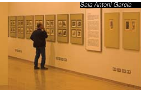
Sala Antoni Garcia