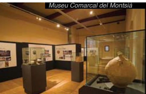
Museu Comarcal del Montsià

Observatori de l'Ebre a Roquetes. Fundat el 1904 pels jesuïtes, és pioner a escala mundial en l'estudi de l'activitat solar, a més de disposar d'una col·lecció d'aparells científics.