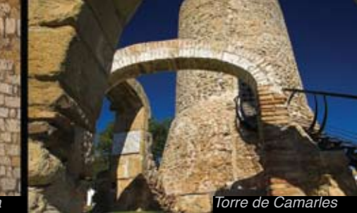
Torre de Camarles

A les Terres de l'Ebre podreu inspirar-vos visitant més de vint castells, entre els quals destaquen per la seva estratègica localització, per la seva documentada història, per la seva magnitud i per les recents rehabilitacions i excel·lent conservació el de la Suda, a Tortosa, el de Miravet, el d'Ulldecona i el de Móra d'Ebre.