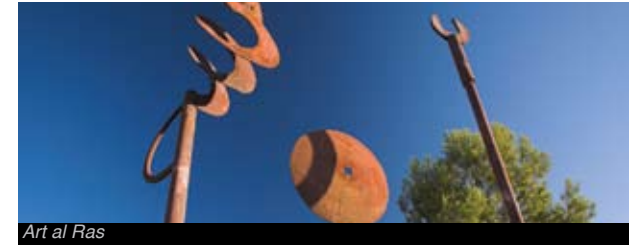
Art al Ras

Al Centre lúdic Tosses XXI d'Amposta, hi ha diverses obres d'art de gran format que us permetran contemplar escultures i pintures en el vostre temps d'oci.