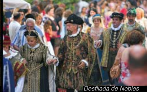
Desfilada de Nobles