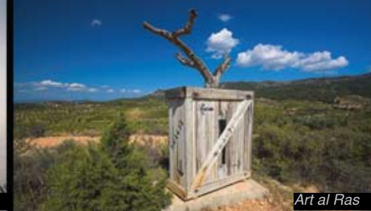
Art al Ras