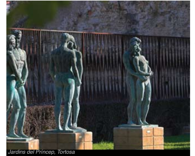
Jardins del Príncep, Tortosa

Als jardins que es troben entre el Castell de la Suda i el Fortí de Tenasses, tot resseguint la muralla que bastí la ciutat al segle XIV, podreu passejar per l'exposició permanent a l'aire lliure de les obres de l'escultor Santiago de Santiago.