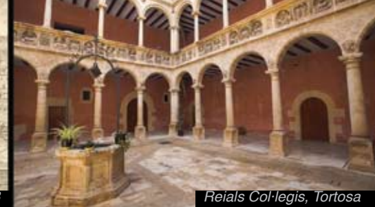
Reials Col·legis, Tortosa