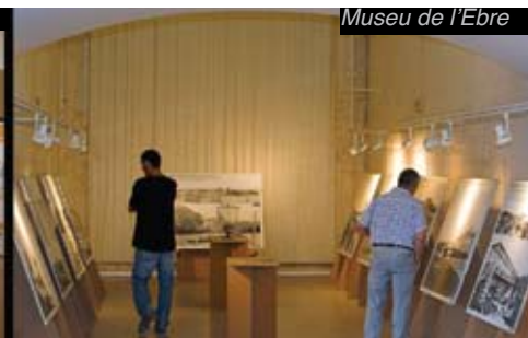
Museu de l'Ebre