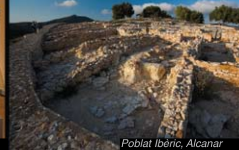
Poblat Ibèric, Alcanar

L'art rupestre de l'Arc Mediterrani de la península Ibèrica està molt ben representat a les Terres de l'Ebre.