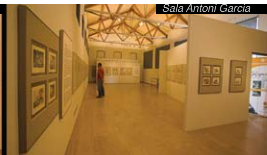
Sala Antoni Garcia