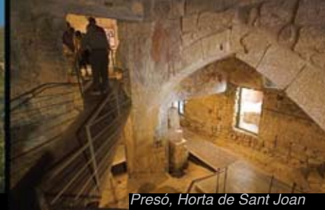
Presó, Horta de Sant Joan

A les Terres de l'Ebre podem trobar altres nuclis de gran bellesa com els barris medievals de Batea, Arnes, Horta de Sant Joan o Tivissa, o d'origen àrab com la vila vella de Miravet, entre d'altres.