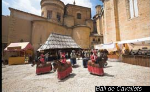
Ball de Cavallets