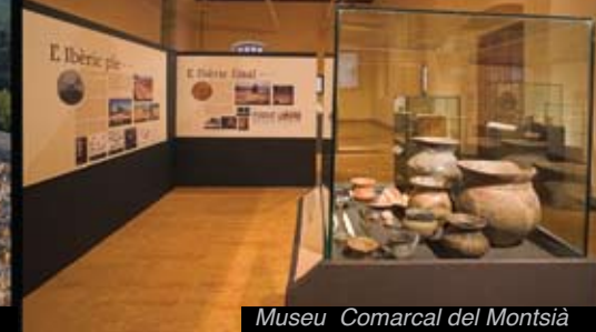
Museu Comarcal del Montsià